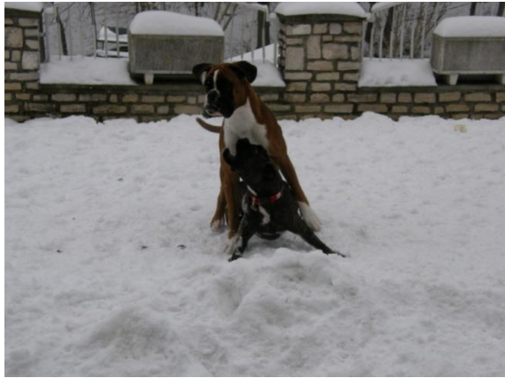
In Vivo - sinček edinček in dokaz zakaj mu pravimo »bizgec«