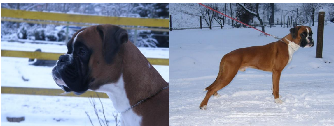
Veliko veselja še naprej in naužite se snega po pameti ☺