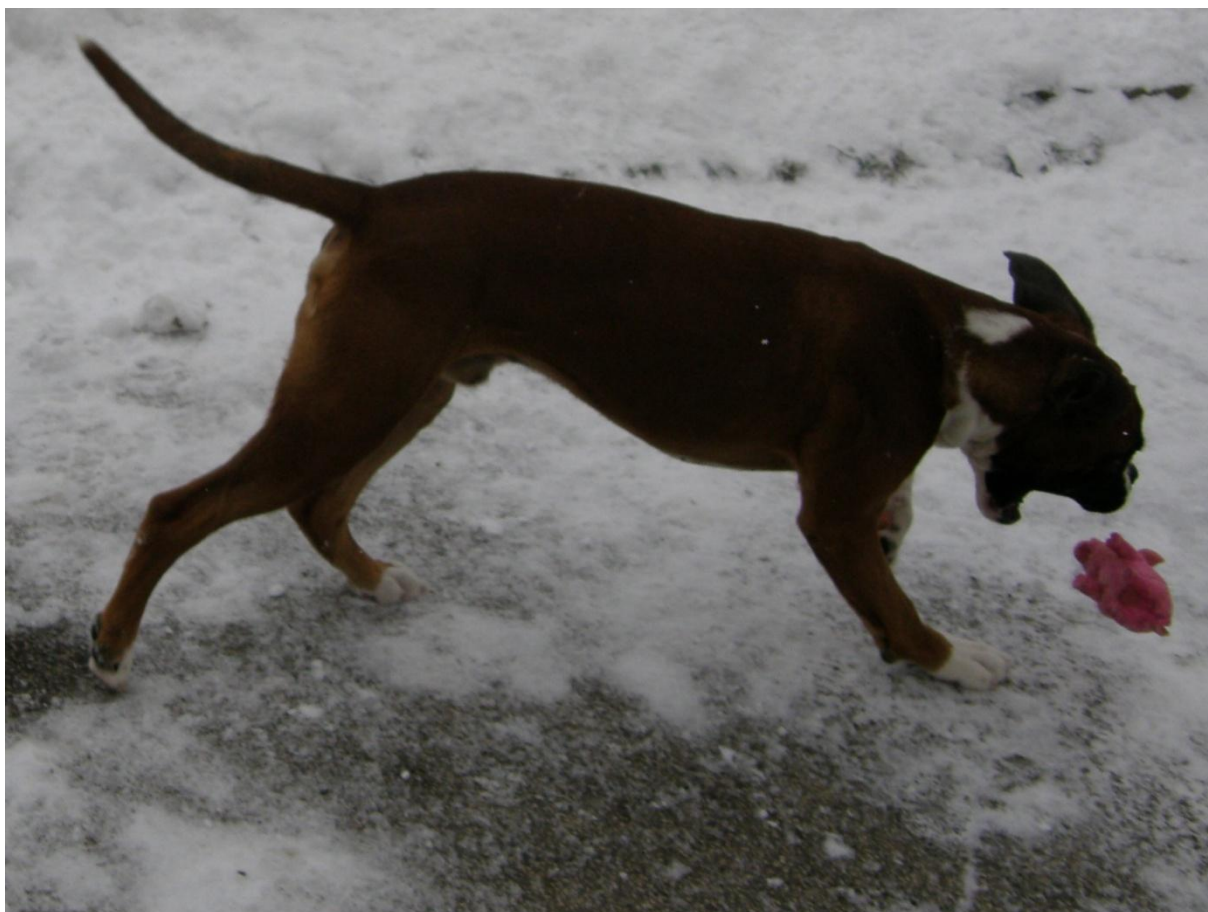
Pa še dve šminkerski!